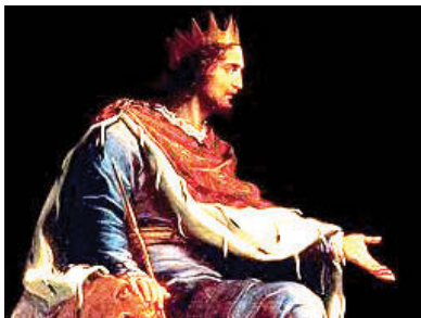
Gbr. 2.3 Raja Salomo

Setelah Daud meninggal, anaknya, Salomo, menduduki takhta kerajaan Israel.