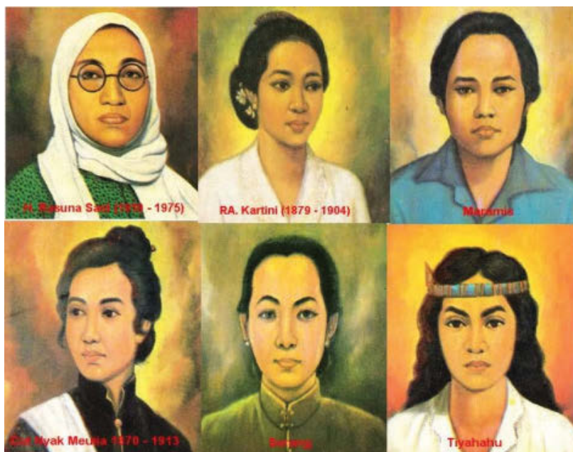
Gbr. 2.6 Tokoh-tokoh Perempuan Indonesia

Perhatikanlah gambar tokoh-tokoh perempuan Indonesia di bawah ini!