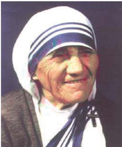
Gbr. 2.5 Bunda Theresa

Baca dan simaklah cerita Ibu Theresa dari Kalkuta India, berikut ini!