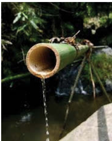
Gbr. 2.7

Alkisah, sebatang bambu yang indah tumbuh di halaman rumah seorang petani. Batang bambu ini tumbuh tinggi menjulang di antara batang-batang bambu lainnya. Suatu hari datanglah sang petani yang empunya pohon bambu itu.