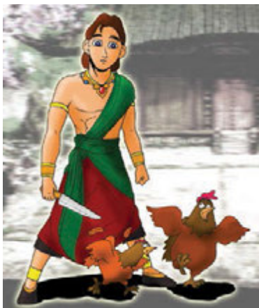
Gbr. 2.1 Pangeran Bungsu

Raja Suta Permana adalah pemimpin bagi rakyat di wilayah Jati Mandala. Ia sangat disayangi rakyatnya, dan disegani kerajaan-kerajaan di sekitarnya. Puluhan tahun, Raja Suta Permana telah memimpin Jati Mandala dengan bijaksana. Rakyat hidup sejahtera dan saling menghormati.