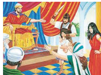
Gbr. 2.4 Raja Salomo yang bijaksana menyelesaikan perkara.

Tak lama kemudian datanglah dua orang perempuan menghadap raja Salomo. Yang pertama berkata kepadanya: “Ya Tuanku, aku dan perempuan ini tinggal bersama dalam satu rumah dan aku melahirkan anak, pada waktu ia di rumah itu. Tiga hari kemudian, perempuan ini pun melahirkan anak. Kami sendirian. Tidak ada orang bersama-sama kami di dalam rumah. Pada waktu malam, anak perempuan ini mati, karena tertindih waktu perempuan ini tidur. Di tengah malam ia bangun, diambilnya anakku dari sisiku dan anakku digantinya dengan anaknya yang sudah meninggal. Tadi