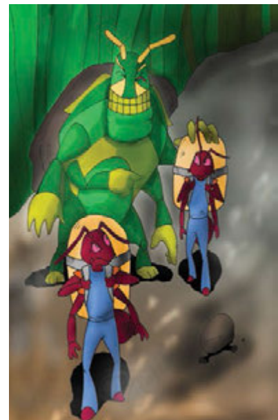
Gbr. 2.2 Semut bekerja keras, sementara belalang malas-malasan

Tidak lama kemudian musim dingin pun tiba. Udara dingin terasa menusuk tulang. Dimana-mana turun salju menutupi jalanan, pepohonan dan rerumputan. Belalang tersiksa karena kemana pun ia pergi tidak ada makanan yang tersedia. Dengan terpaksa ia pun mendatangi semut sambil memohon: “Hai semut, sahabatku. Berilah aku sedikit makananmu, karena aku sangat kelaparan”. Tetapi semut menjawab: “Maaf, persediaan makananku harus cukup sampai musim dingin berakhir”. Belalang pun agak memaksa: