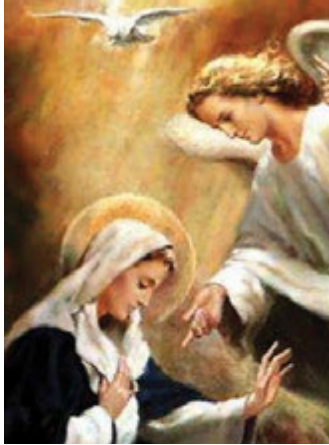
Gbr. 2.9 Maria dan malaikat

Kata Maria kepada malaikat itu: “Bagaimana hal itu mungkin terjadi, karena aku belum bersuami?” Jawab malaikat itu kepadanya: “Roh Kudus akan turun atasmu dan kuasa Allah Yang Mahatinggi akan menaungi engkau; sebab itu anak yang akan kaulahirkan itu akan disebut kudus, Anak Allah. Dan sesungguhnya, Elisabet, sanakmu itu, ia pun sedang mengandung seorang anak laki-laki pada hari tuanya dan inilah bulan yang keenam bagi dia, yang disebut mandul itu. Sebab bagi Allah tidak ada yang mustahil.”