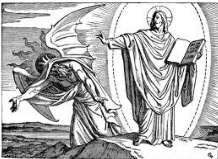
Gbr. 2.10 Yesus dan Iblis

Pada usia tiga puluh tahun, Yesus mulai menampakkan diri di depan umum. Selama itu, Yesus tinggal di Nazaret bersama ibu dan ayahnya, Maria dan Yosef. Setiap hari Yesus bekerja bersama Yosef sebagai tukang kayu.