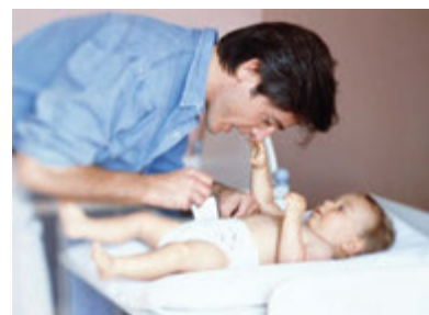
Gbr. 1.11 Seorang bapak memakaikan popok