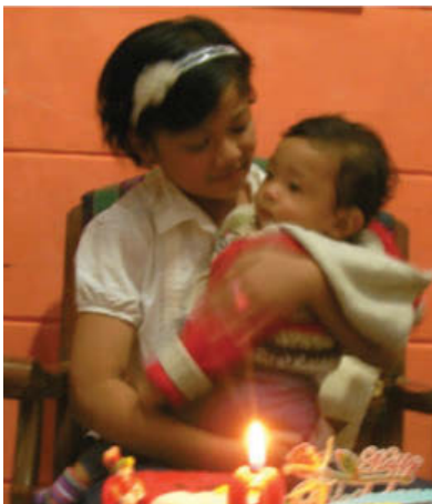
Gbr. 1.3 Anak yang masih kecil dan anak yang lebih besar

Untuk mengetahui dan memahami arti perkembangan, marilah kita memperhatikan gambar di bawah ini!