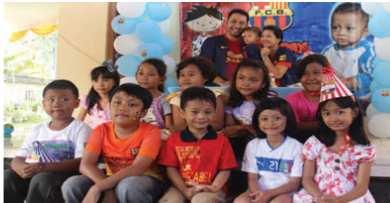
Gbr. 1.4 anak laki-laki dan perempuan

Setelah mengamati gambar-gambar di atas, jawablah pertanyaan-pertanyaan di bawah ini!