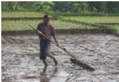
Gbr. 1.6 Bapak Petani