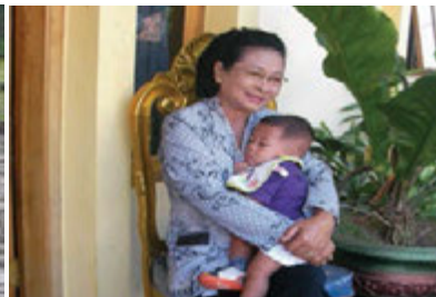
Gbr. 1.7 Ibu menggendong bayi