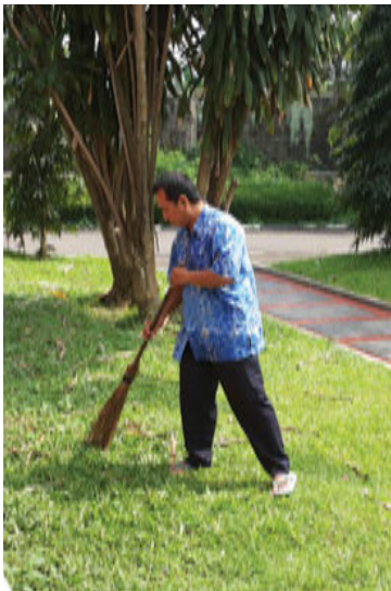
Gbr. 1.9 Seorang bapak menyapu halaman