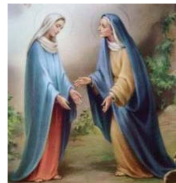
Gbr 2.8 Maria dan Elisabet

Pada suatu kali, waktu tiba giliran rombongannya, Zakharia melakukan tugas keimaman di hadapan Tuhan. Sebab ketika diundi, sebagaimana lazimnya, untuk