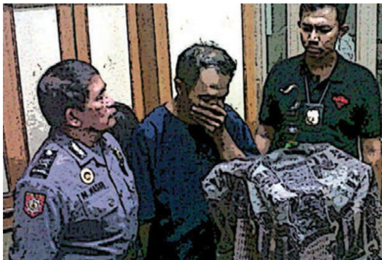
Gbr. 2.11 orang yang diselamatkan polisi dari amuk massa