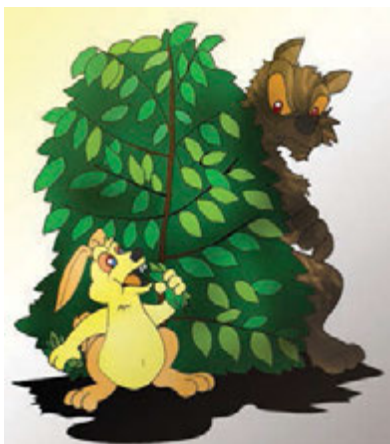
Gbr. 2.10 Kelinci dibalik pohon kopi Sumber : Dok. Kemdikbud

Pada suatu pagi, seekor anak kelinci yang lucu sedang menikmati wortel di kebun pinggiran hutan. Karena lapar, kelinci itu makan dengan lahap. Ia tidak menyadari bahwa ada seekor serigala yang mengendap-endap, hendak memangsanya.