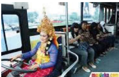
Gbr. 1.10 Perempuan mengemudi