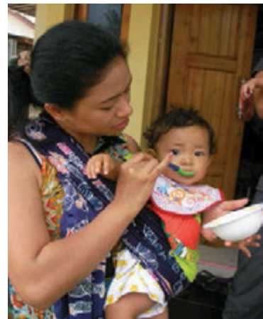
Gbr. 1.8 Ibu menyuapi anaknya