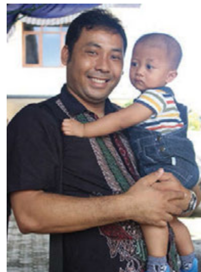
Gbr. 1.2 Seorang bapak menggendong putranya

Dalam hal ini, kita menyadari bahwa laki-laki dan perempuan memiliki perbedaan yang kodrati, yaitu perbedaan yang tidak bisa diubah. Misalnya, laki-laki tidak mungkin mengandung dan melahirkan anak.