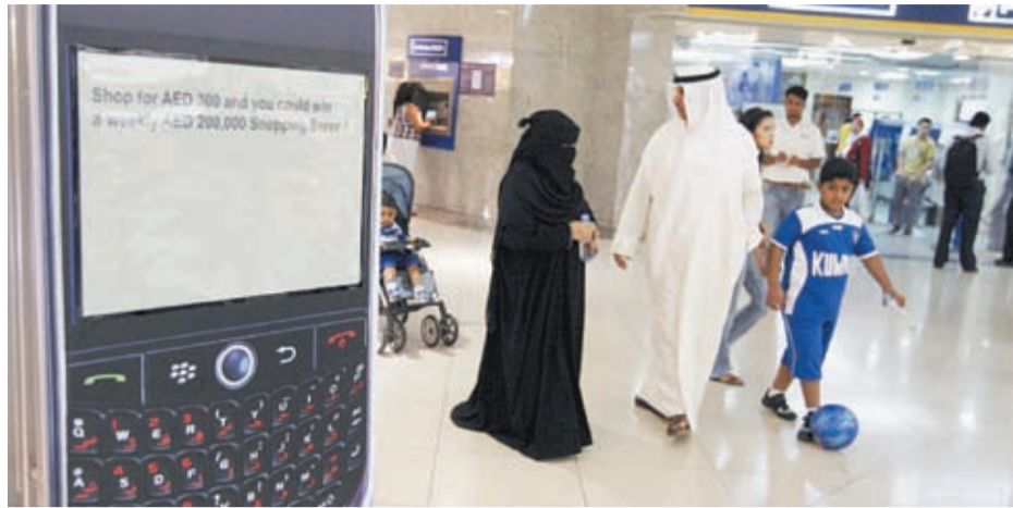
Iklan BlackBerry di sebuah mal di Emirat Arab.

Layanan BlackBerry pengelolaan datanya terpusat di RIM sehingga sulit terpantau.