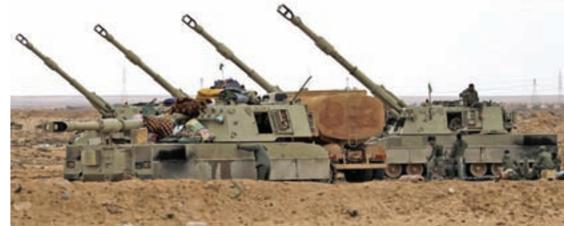
Senjata artileri milik pasukan pemerintah Libya yang ditempatkan di Kota Ajdabiya

Sejak Sabtu (19/3) pasukan koalisi membombardir pangkalan militer Libya. Gempuran itu melumpuhkan sebagian kekuatan militer Libya.