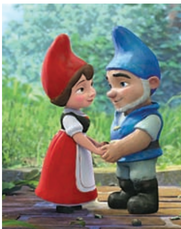
DOK GNOMEO AND JULIET