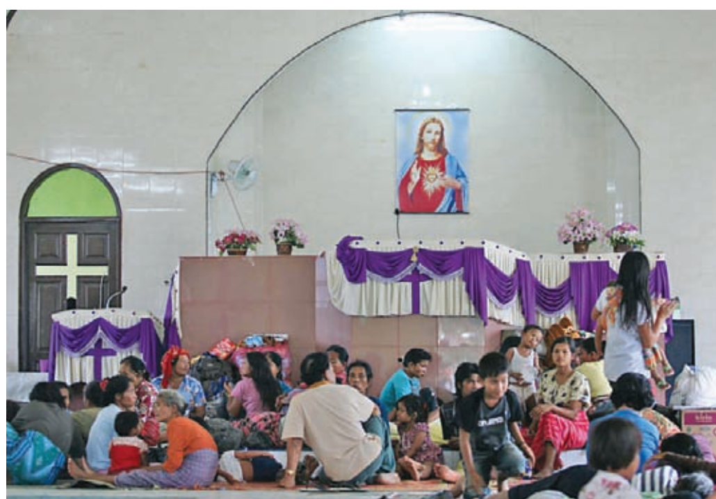
MENGUNSI DI GEREJA: Warga korban letusan Gunung Sinabung mengungsi di Gereja Batak Karo Protestan, Perbesi, Kabupaten Tanah Karo, Sumatra Utara, kemarin. Pengungsi di gereja tersebut mencapai 800 jiwa.

Di sisi lain, sekitar 300 sapi dan kerbau milik warga Desa Gambir, Kecamatan Simpang Empat, dilaporkan mulai lemas