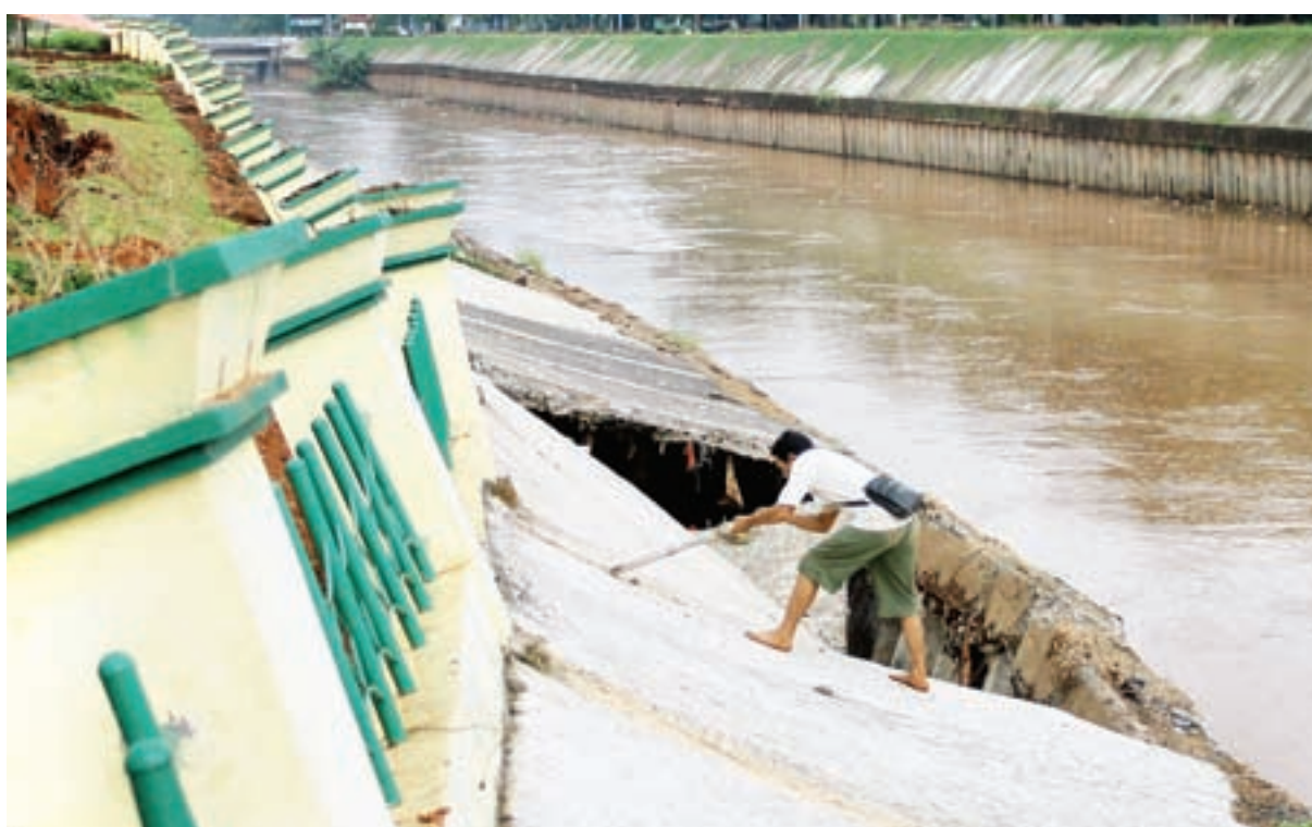
BISNIS/MELLY RIANA SARI

"Diperlukan pengembangan pola kerja sama antardaerah terutama kota besar dengan daerah lainnya melalui pemerintah pusat," ujarnya. (TH. D. WULANDARI)